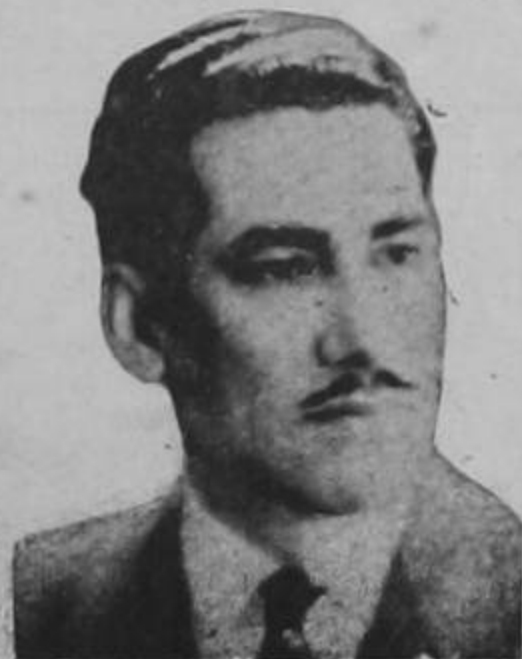
Dr. Arnulfo Arias

NOVEDADES ofrece hoy el texto de las declaraciones del nuevo Presidente de la República de Panamá, doctor don Arnulfo Arias, en las que define su política con respecto a los Estados Unidos y aborda los más importantes problemas administrativos de Panamá. Sin aspavientos, sin anuncios, sin decir que se ofrecerán declaraciones gracias a estos o aquellos servicios, y sin anunciar exclusiones, corresponde a NOVEDADES suministrar el texto íntegro de las declaraciones del señor Presidente de Panamá, doctor Arias.