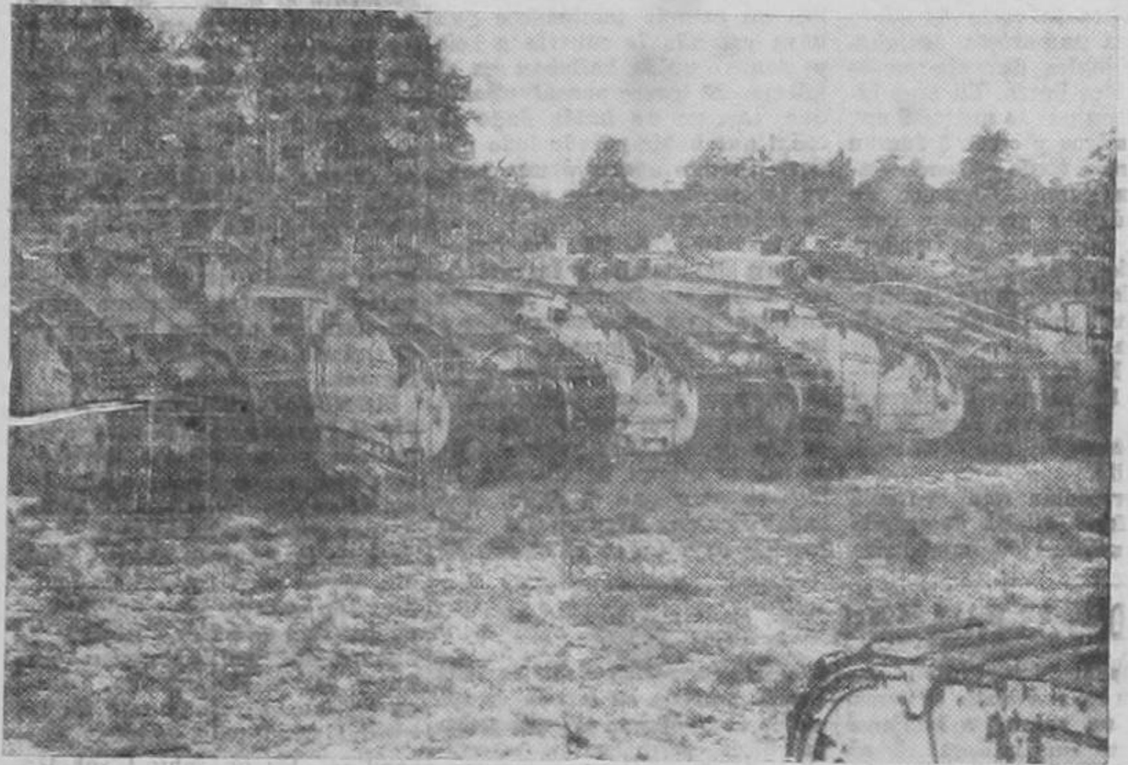
Estados Unidos no sólo le vende aviones y destructores a Inglaterra, sino también tanques. He aquí un gran número de gusanos de acero transportados al Canadá para reforzar los planes de defensa del Dominio.

Los industriales fruncen el ceño, porque con esta maniobra Roosevelt les está revocando la franquicia que tenían, desde tiempo inmemorial, para convertirse en árbitros de la situación so pretexto de la guerra. En eso consiste el impasse de Washington hoy día: ni el capital ni el trabajo están dispuestos a sacrificarse en aras del bienestar nacional.